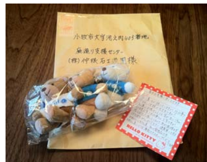
心温まるメッセージが力となります