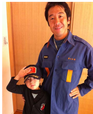
誇りを受け継ぐ未来の消防団員